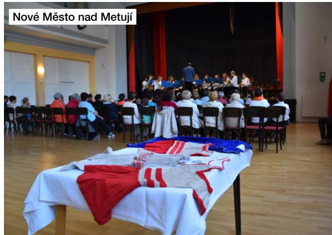
Nové Město nad Metují